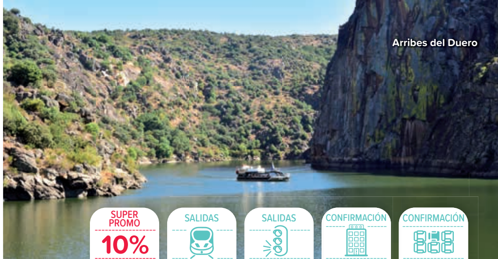
Arribes del Duero

No incluye: Seguro cancelación, guías locales, entradas ni tasas turísticas salvo indicación en contra