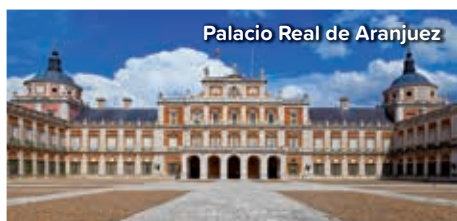
Palacio Real de Aranjuez