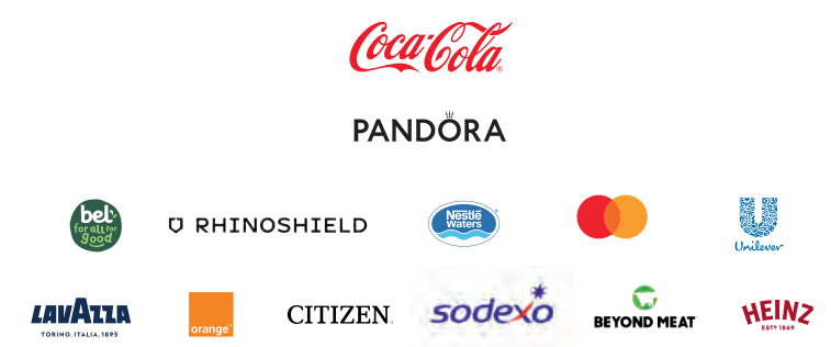
Socios oficiales en el momento de la impresión.

DISNEYLAND® PARIS DA LAS GRACIAS A SUS SOCIOS OFICIALES